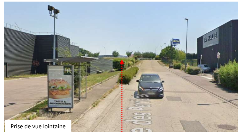
Emplacement du projet