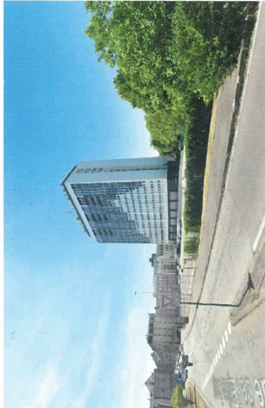
VUE 3 depuis la rue de l'Eglise Rouge - juillet 2020