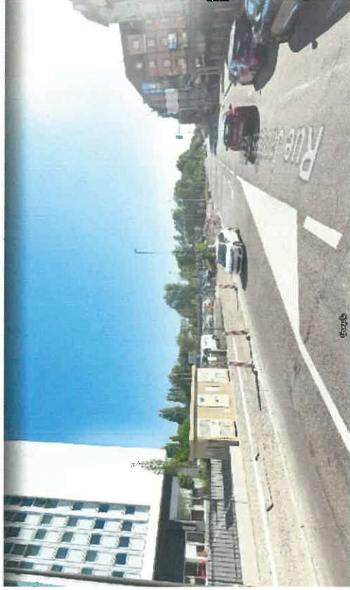
VUE 2 depuis le sud de la rue Jacques Kablé - juillet 2020