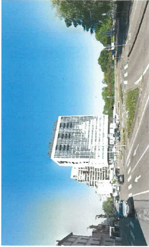
VUE 1 depuis le nord de la rue Jacques Kablé - juillet 2020