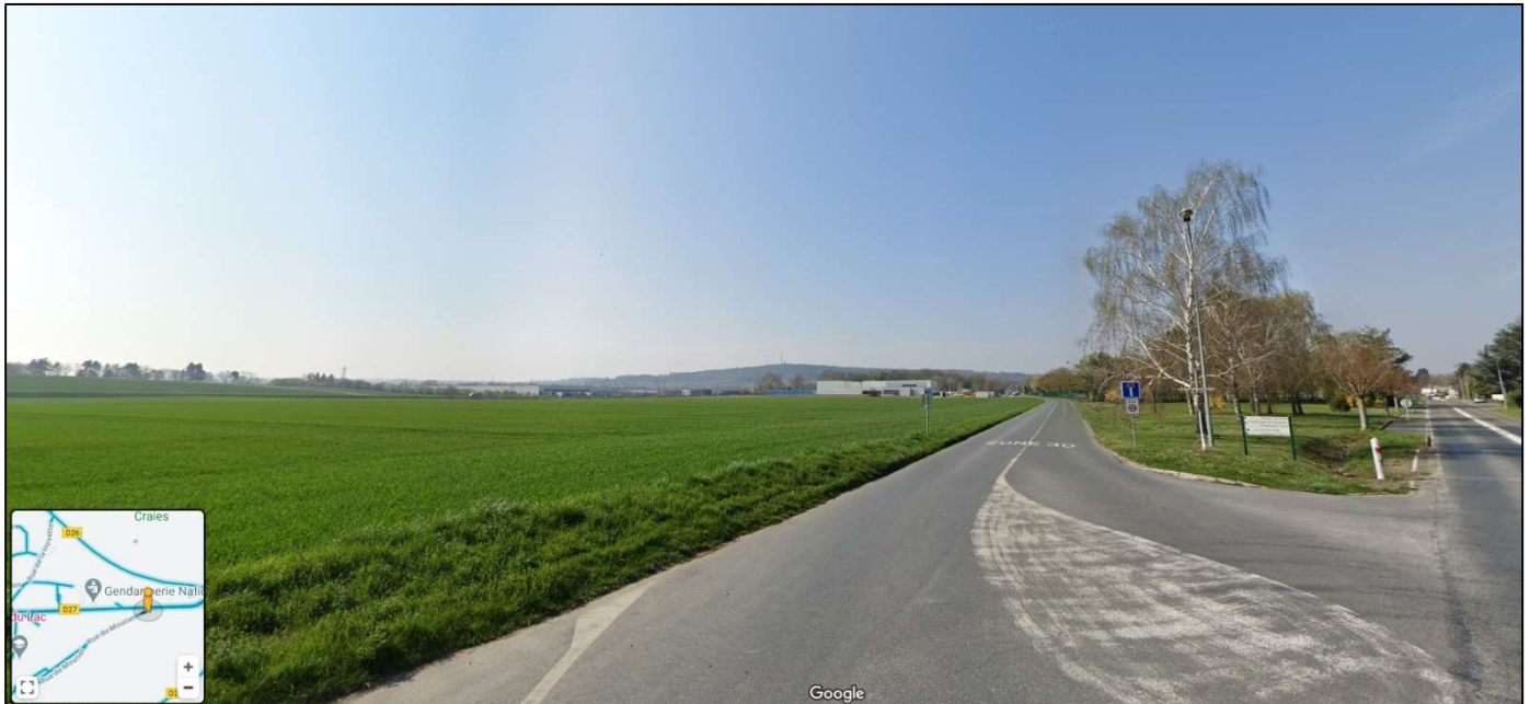
Vue de la zone projet à l'entrée de Gueux, au carrefour de la rue du Moutier et de l'avenue de Reims (RD27)