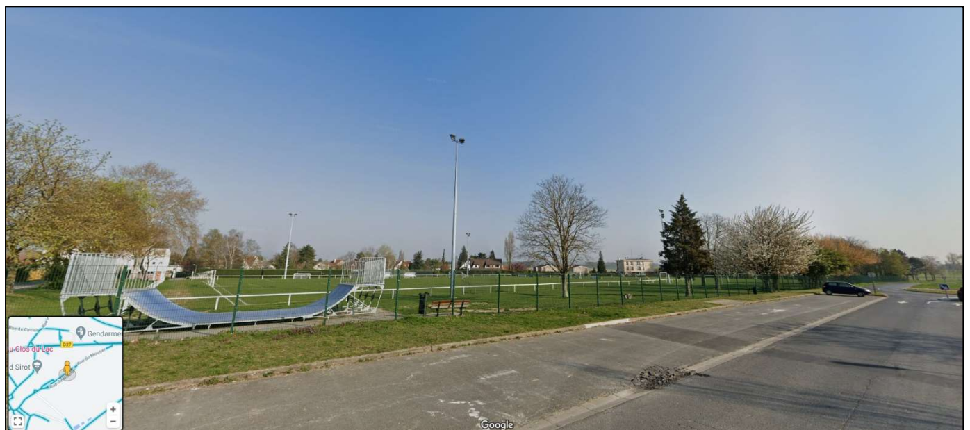
Vue de la zone projet sur les terrains de football existants, depuis la rue du Moutier