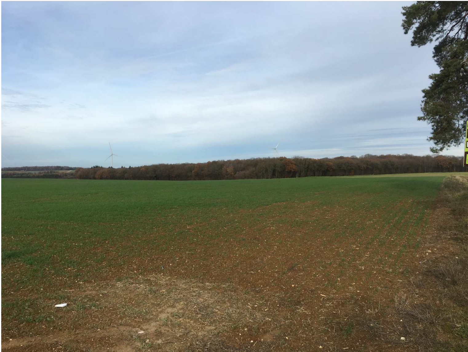
Figure 5 : Photo du futur site de méthanisation (forage à 300m)