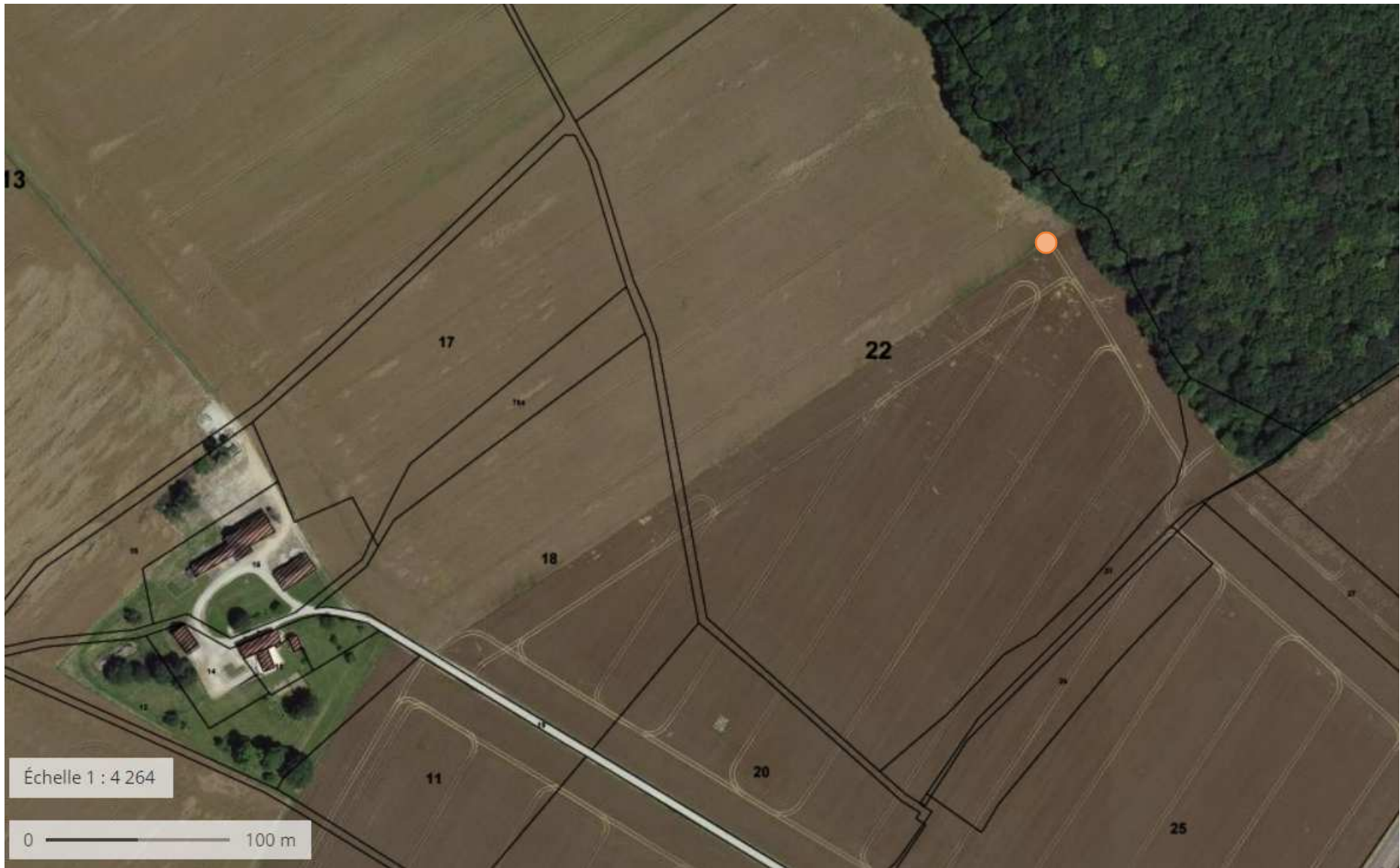
Figure 3 : Localisation du forage sur un plan cadastrale (géoportail.fr)