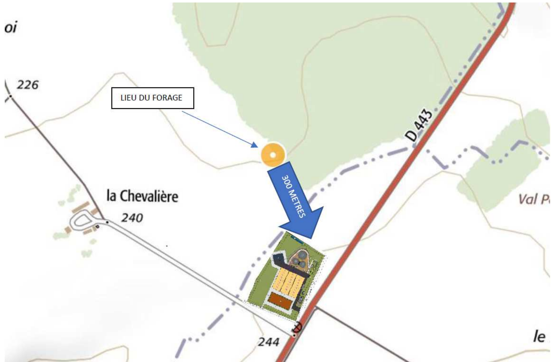
Figure 4 : Implantation du forage sur un plan du site de méthanisation