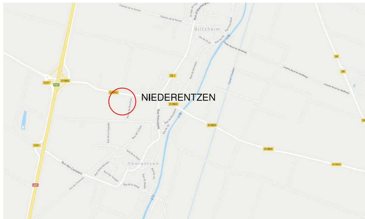
> Plan de situation

Route de Roufflach - RD18b 68127 NIEDERENTZEN PARCELLES: 000 32 234/235/236 Surface totale: 28510 m2