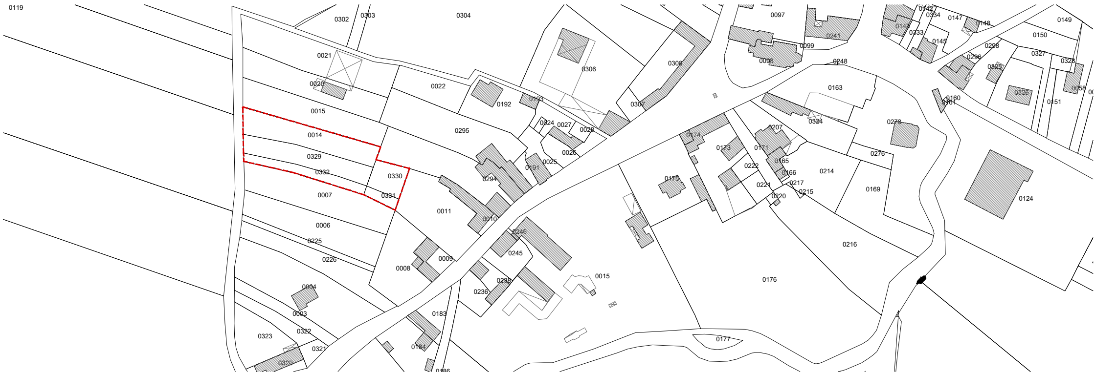
Cadastre_1. 2000e 0 25 50