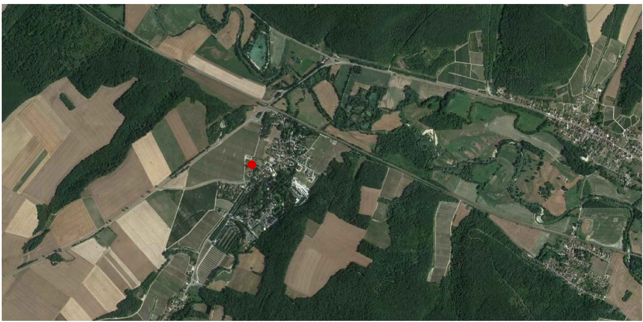
Vue aérienne_1.16 000e 0 250 500

Adresse parcelle: > Chemin de Chantecoq 10200 Dolancourt