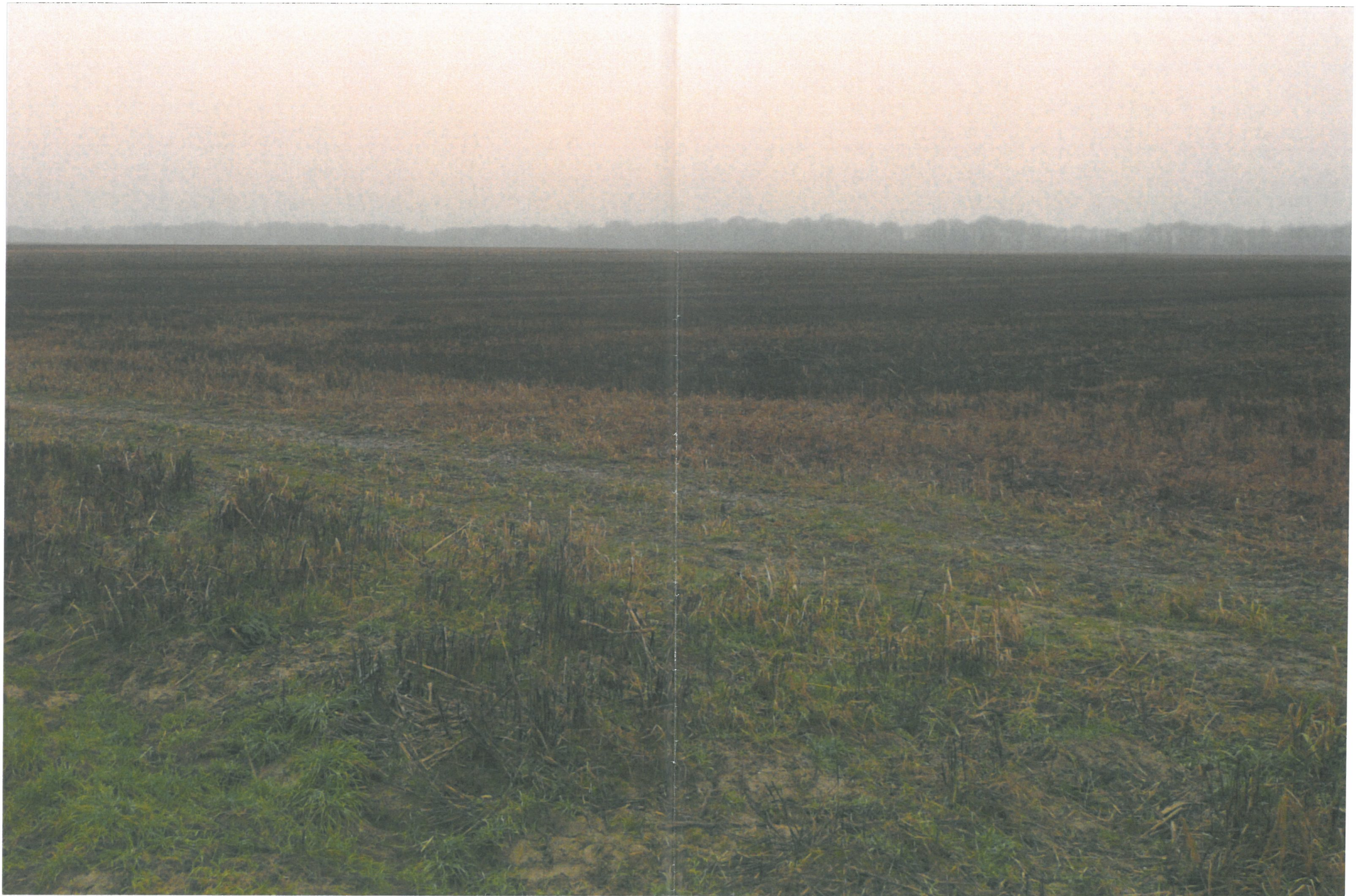
Commune de Warmeriville Aménagement de la ZA Val des Bois