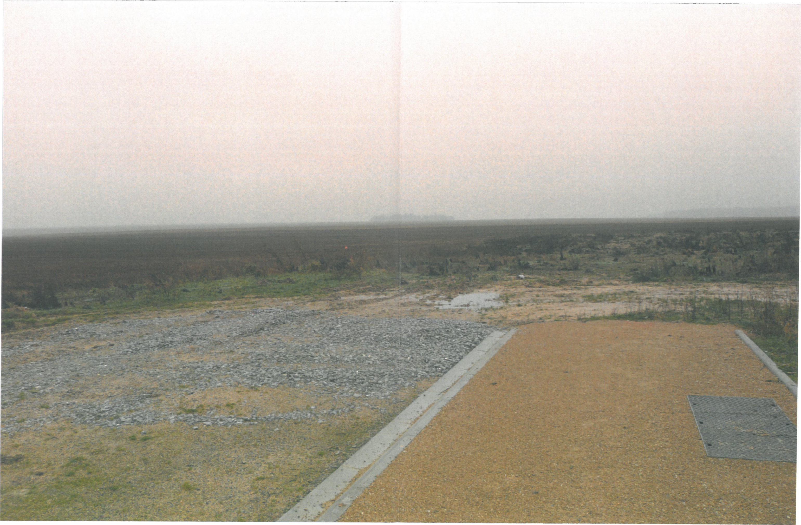
Commune de Warmeriville Aménagement de la ZA Val des Bois