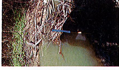
Barrage se trouvant le long du chemin des Aulnes Limite acceptable : +20 à +30 cm du niveau actuel (soit niveau bas de la berge)