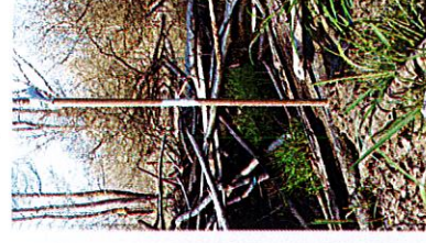
Barrage limite Evigny Limite acceptable : niveau actuel (soit +20cm par rapport au haut de la berge, rive droite)