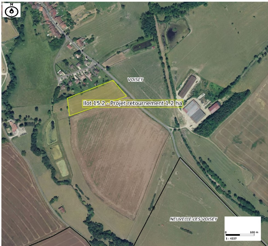
Îlot 15.2 :