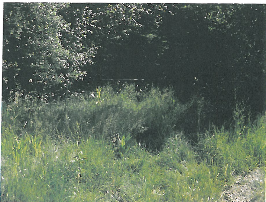
Tronçon 1 chemin à créer photo A