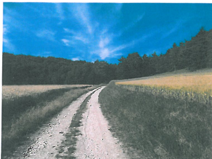
Dossier d'Autreville sur la Renne. Tronçon 3. Poursuite et réfection de ce chemin. Vue d'ensemble.