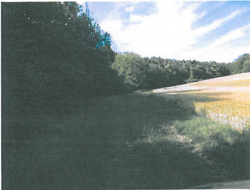
Chemin à empierrer