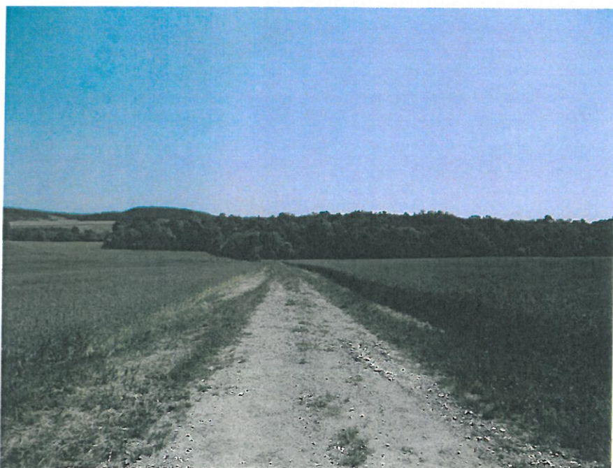
Vue d'ensemble tronçon 1 photo B