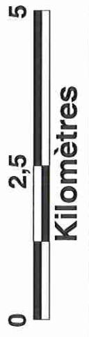
CARTE DE LOCALISATION DU SITE NATURA 2000 "JURA ALSACIEN"