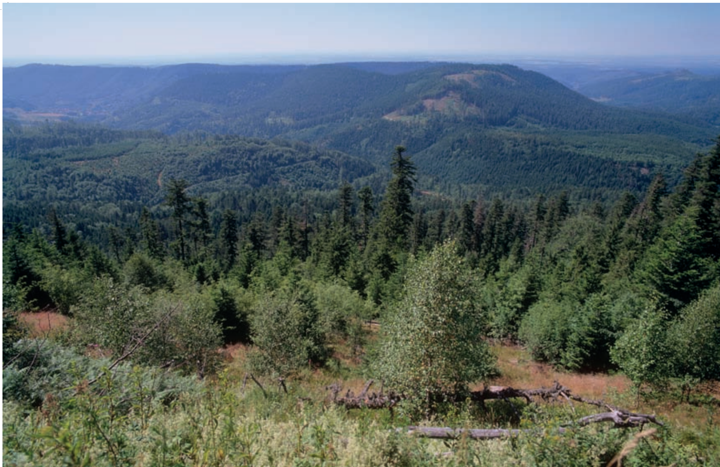
1 Vue sur les Vosges mosellanes depuis le Donon 2 Jeune Faucon pèlerin