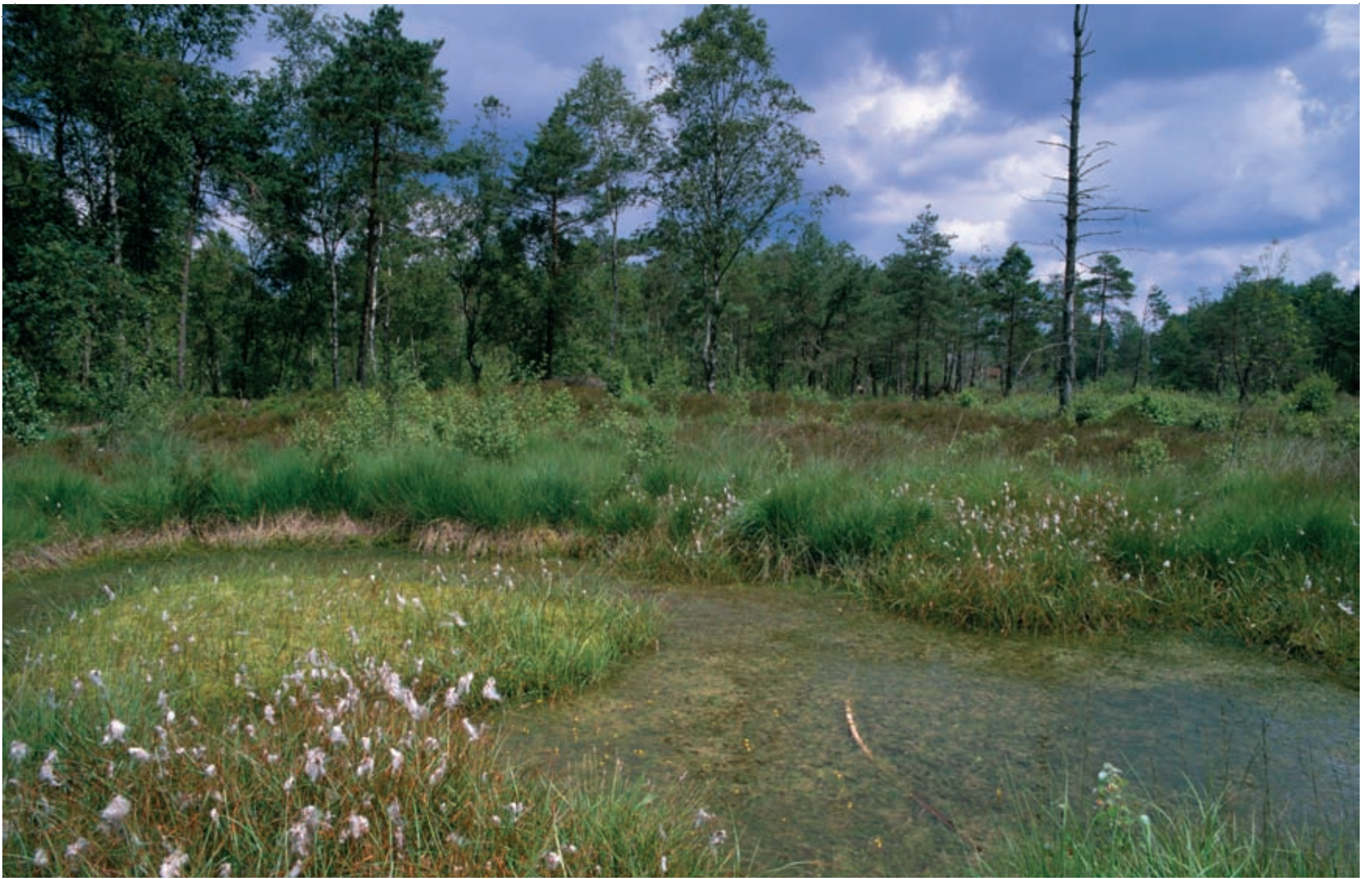
1 La tourbière de la Demoiselle 2 L'étang de la Demoiselle