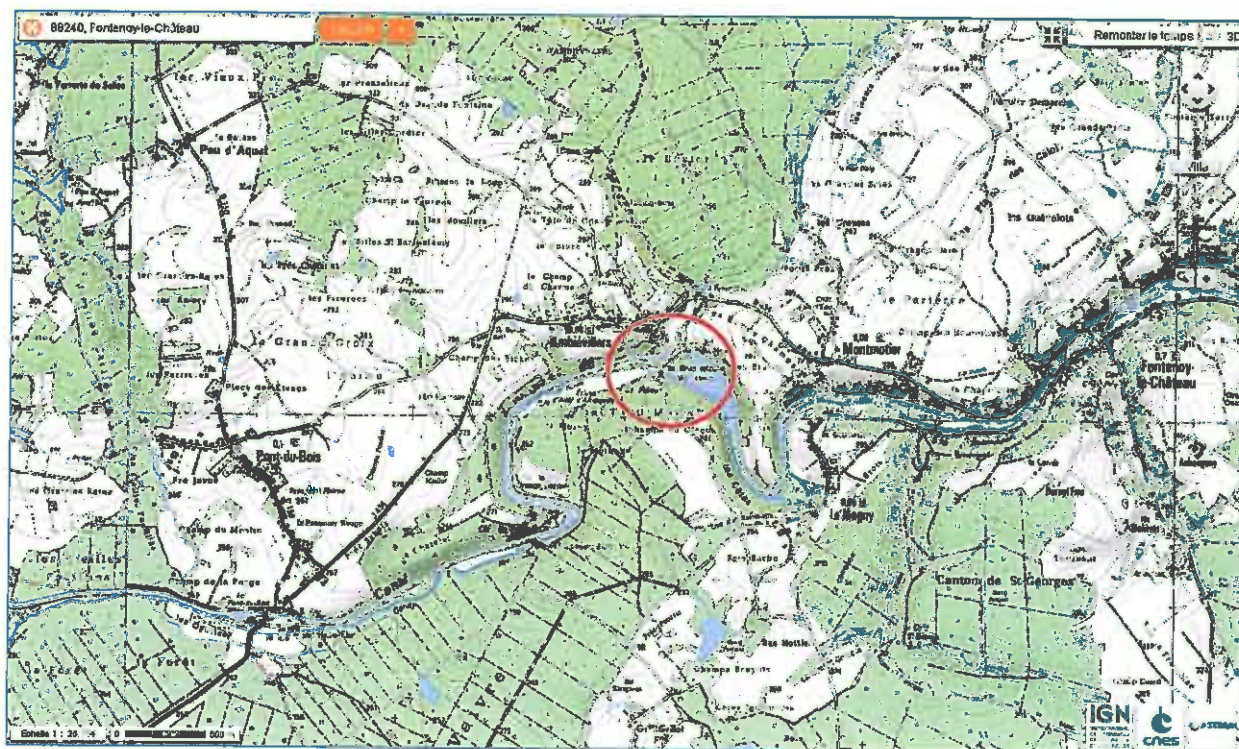
Figure 2 : Extrait de carte IGN à l'échelle 1/25000ème avec emplacement du site