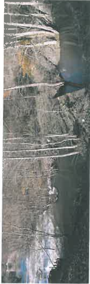
Photos n° 10 et 11 : Confluence du Coney avec le ruisseau du Bon Vin et zone plus profonde