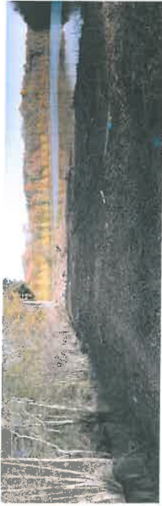
Photos n° 8 et 9 : Digue de la retenue en rive droite du barrage, et confluence du Coney avec le ruisseau du Bon Vin