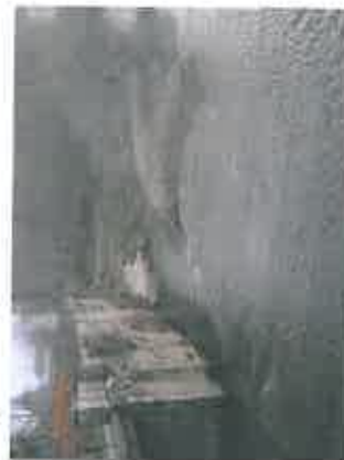
Photos n° 5 et 6 : Radier bétonné de l'ouvrage et pont d'accès au site