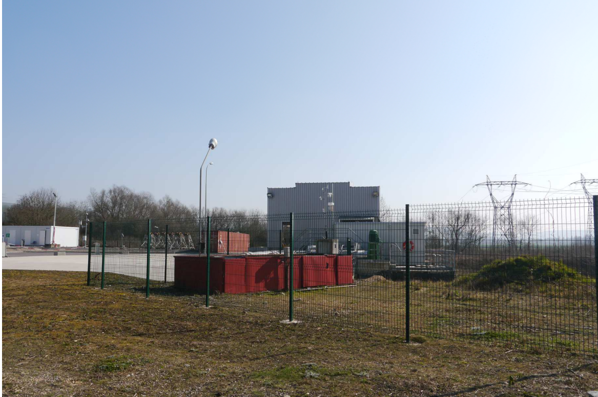
Vue depuis la grille de raccordement – 12 mars 2014

Vue n°4 : zone d'implantation du second support neuf (7N) :