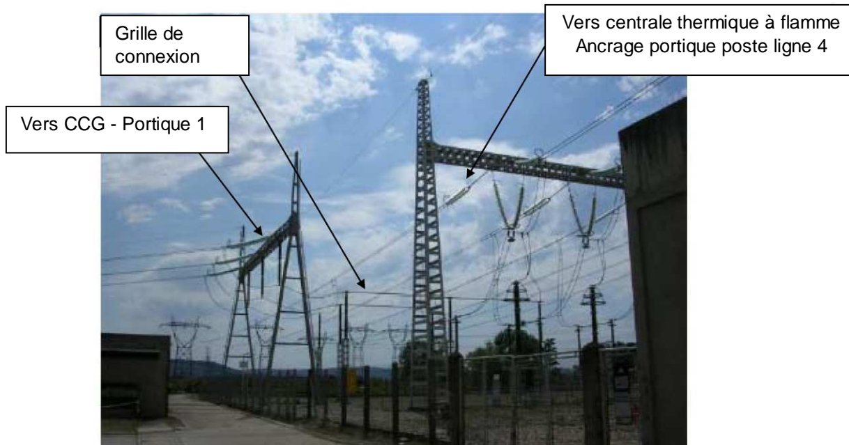
Vue depuis la centrale thermique – Photo septembre 2013