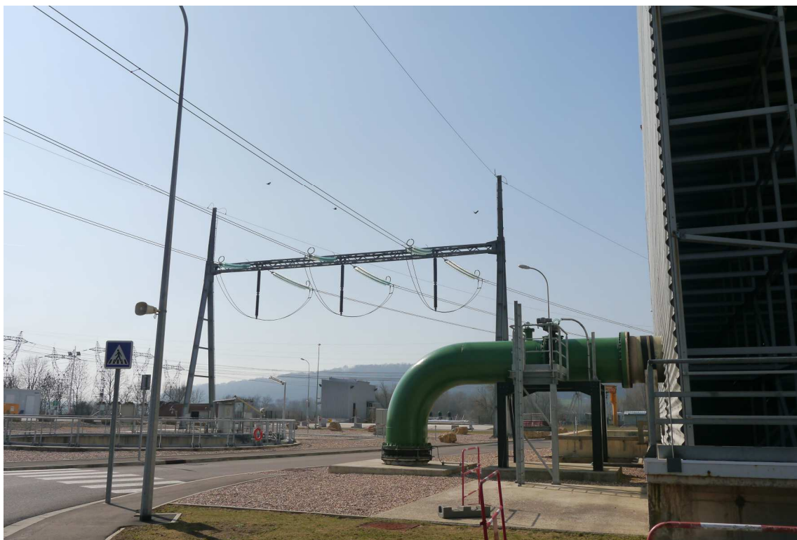
Vue depuis le CCG – 12 mars 2014

Vue n°2 : ligne de raccordement du CCG :