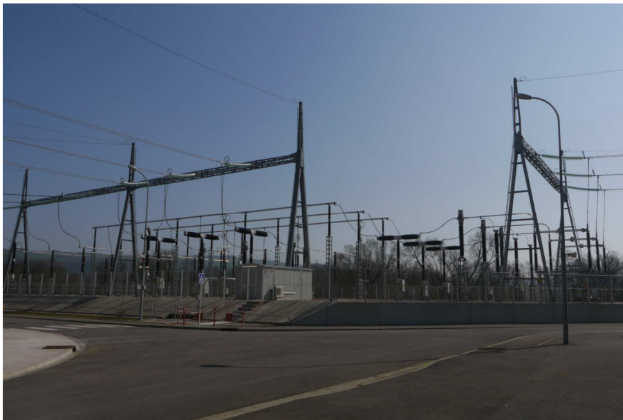
Vue depuis le CCG – 12 mars 2014

Vue n°5 : Poste EDF d'évacuation de la production du CCG :