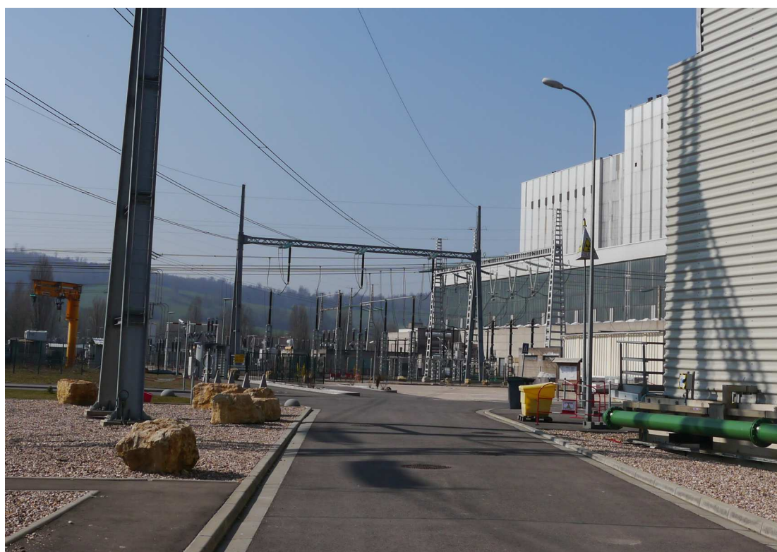
Vue depuis la ligne de raccordement au Cycle Combiné Gaz (CCG) - 12 mars 2014