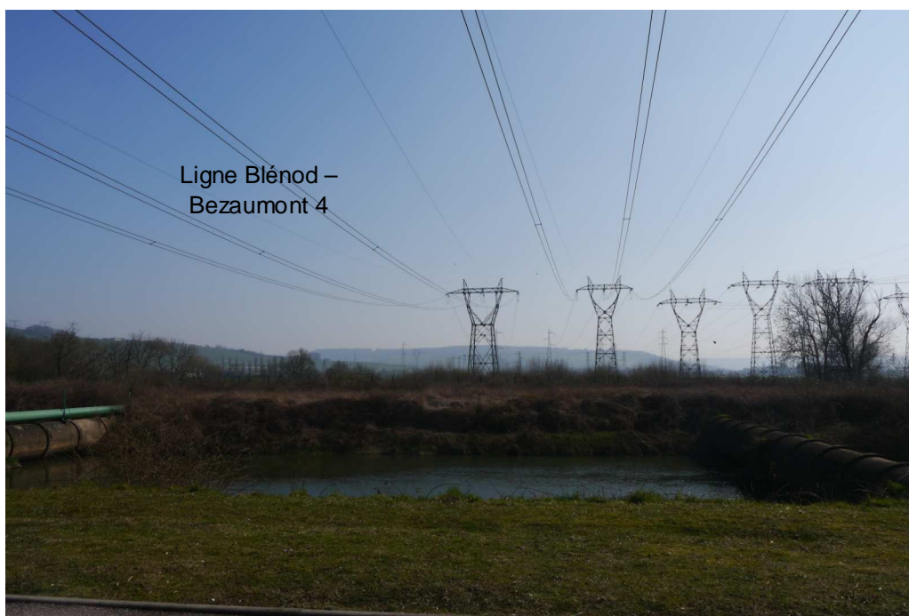
Vue depuis la grille de raccordement – 12 mars 2014

Vue n°3 : zone d'implantation du premier support neuf (6N),