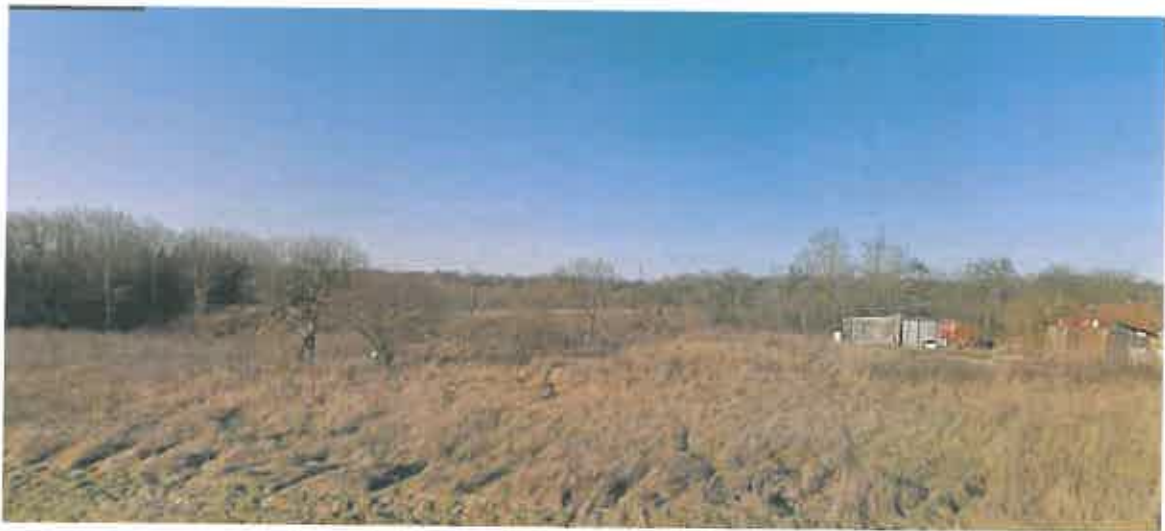
Photographie 3 : RN 52 (Décembre 2009)