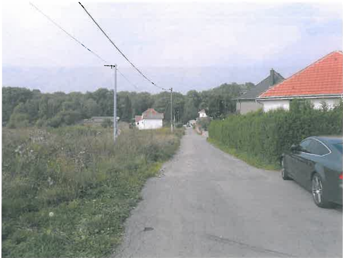
Photographie 1 : Rue d'Halanzy (09/09/2014)