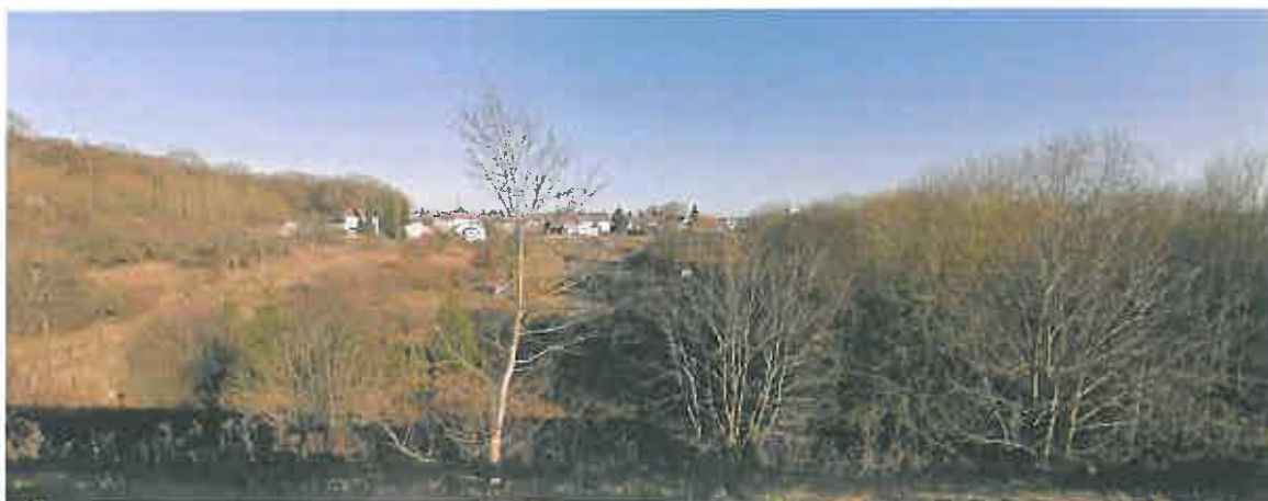
Photographie 4 : RN 52 (Novembre 2009)