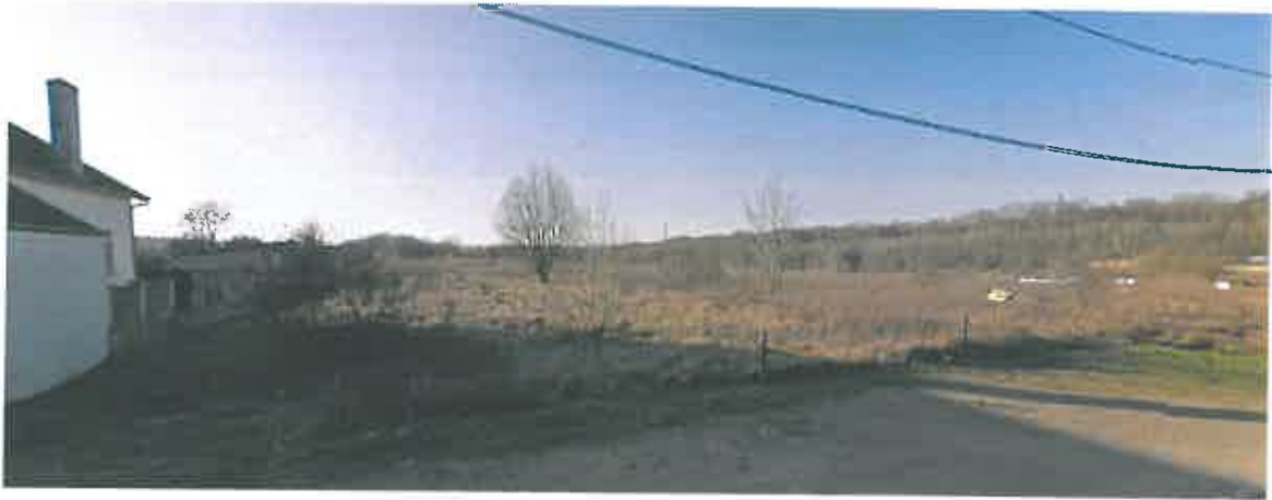
Photographie 2 : Rue d'Halanzky (Décembre 2009)