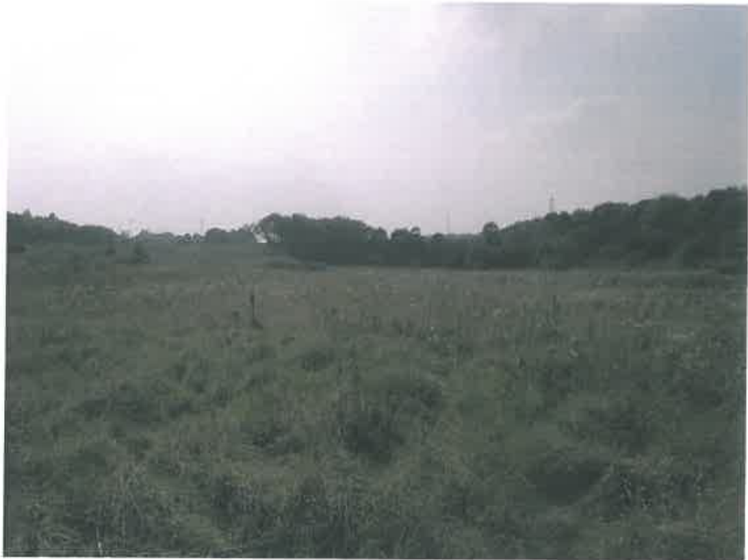
Photographie 6 : Vue du site (09/09/2014)