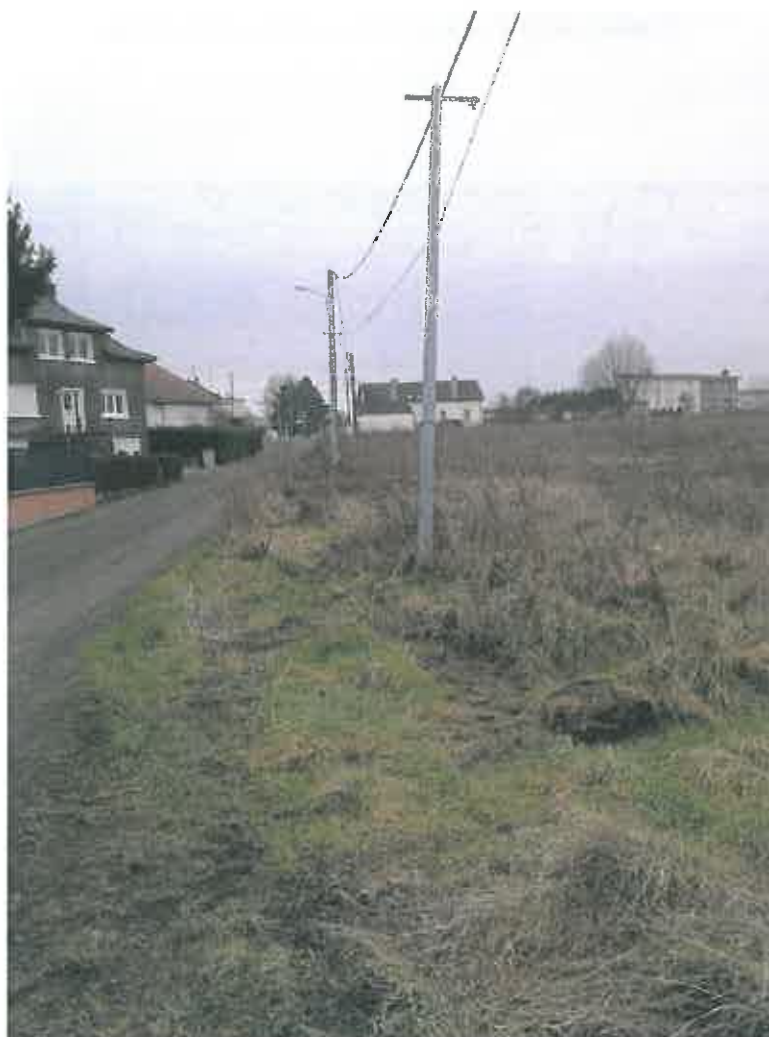
Photographie 5 : Rue d'Halanz (09/09/2014)