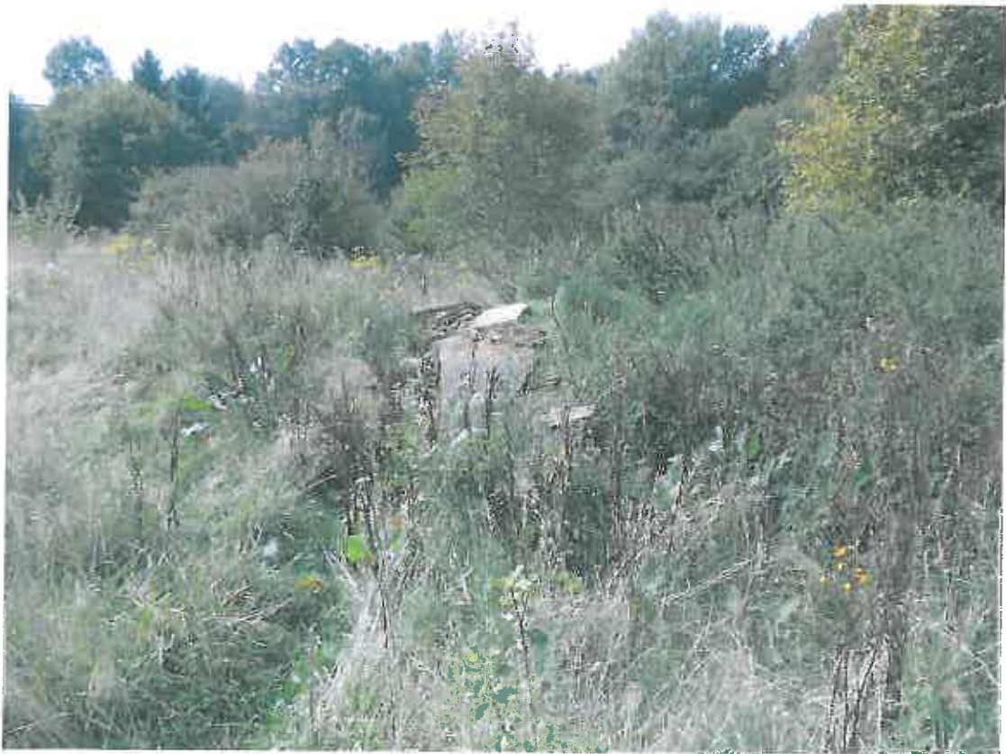
Photographie 7: Vue du site (09/09/2014)