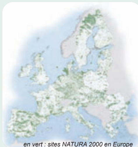
en vert : sites NATURA 2000 en Europe

Le document d'objectifs de la « vallée de la Meurthe de La Voivre à Saint-Clément et tourbière de la Basse Saint-Jean » a été validé par le comité de pilotage du site le 25 février 2008. La maîtrise d'ouvrage de sa mise en œuvre est confiée par l'Etat au conseil général de Meurthe-et-Moselle.