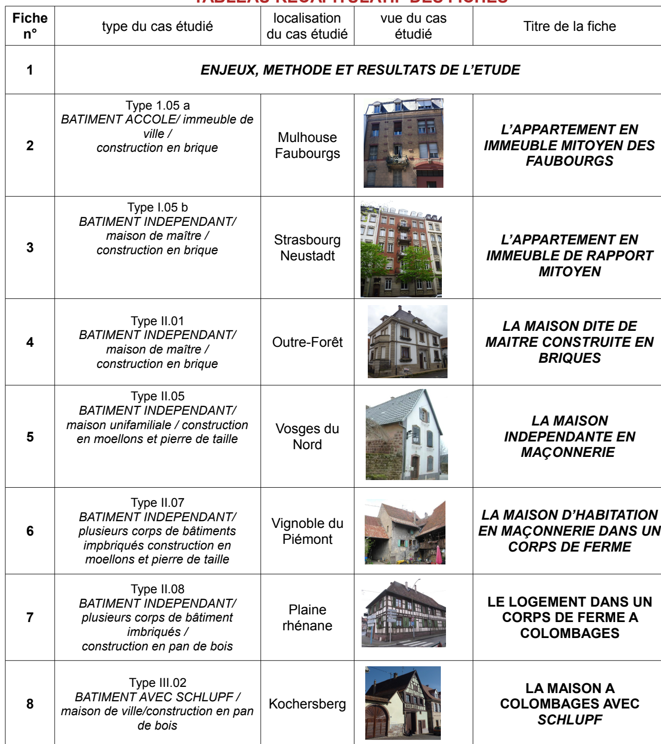
TABLEAU RECAPITULATIF DES FICHES