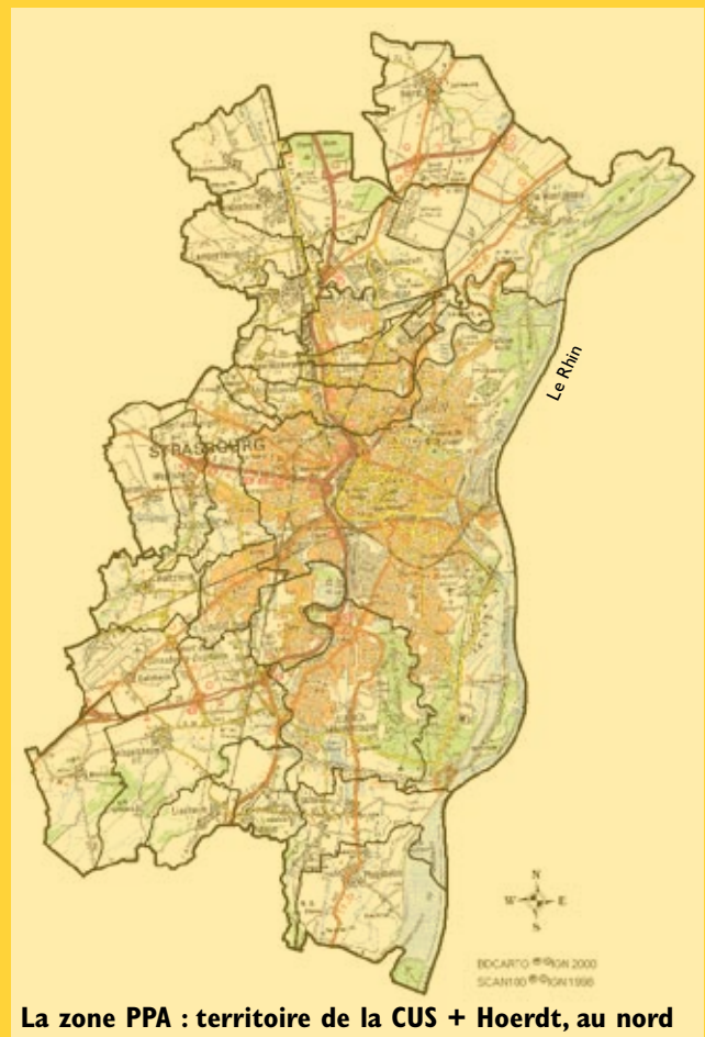
La zone PPA : territoire de la CUS + Hoerdt, au nord

Prévus par la loi du 30 décembre 1996 sur l'air, les PPA sont régis par le décret n°2001-449 du 25 mai 2001. Ils doivent être mis en place dans les agglomérations de plus de 250 000 habitants et dans les zones dans lesquelles les valeurs limites de qualité de l'air ne sont pas respectées. En Alsace, l'agglomération strasbourgeoise fait l'objet de la mise en œuvre d'un tel plan.