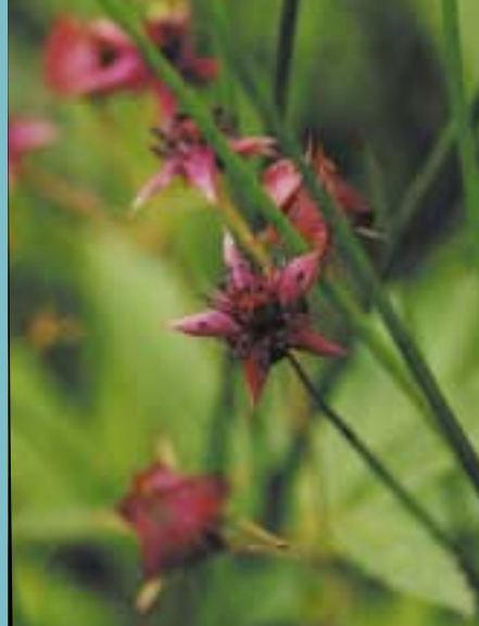
Le Comaret des marais, cette très belle fleur, d'intérêt régional, se rencontre parfois dans les friches humides