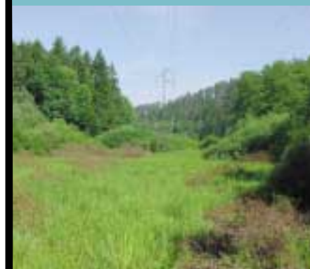
Une coupe systématique des arbres et arbustes permet de bloquer l'évolution naturelle (ici sous une ligne haute-tension)

Habitats naturels : zones terrestres ou aquatiques se distinguant par leurs caractéristiques géographiques, le non vivant (sol, climat, géologie etc...) et le vivant (faune et flore), qu'elles soient entièrement naturelles ou semi-naturelles.