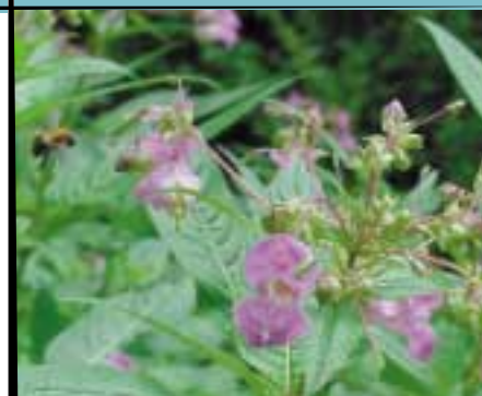
La Balsamine de l'Himalaya, une espèce particulièrement invasive dans les Vosges du Nord

Les friches des Vosges du Nord représentent un refuge pour de nombreux oiseaux. Certaines espèces comme la Rousserolle effarvate, la Locustelle tachetée, la Pie-grièche écorcheur ou le Tarier pâtre (ci-contre) y sont particulièrement bien représentées. La préservation des friches à différents stades d'évolution permettra de les préserver durablement.