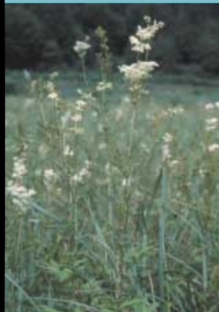
La Reine des prés