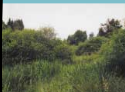
La Saulaie précède le stade forestier, cette évolution est très lente