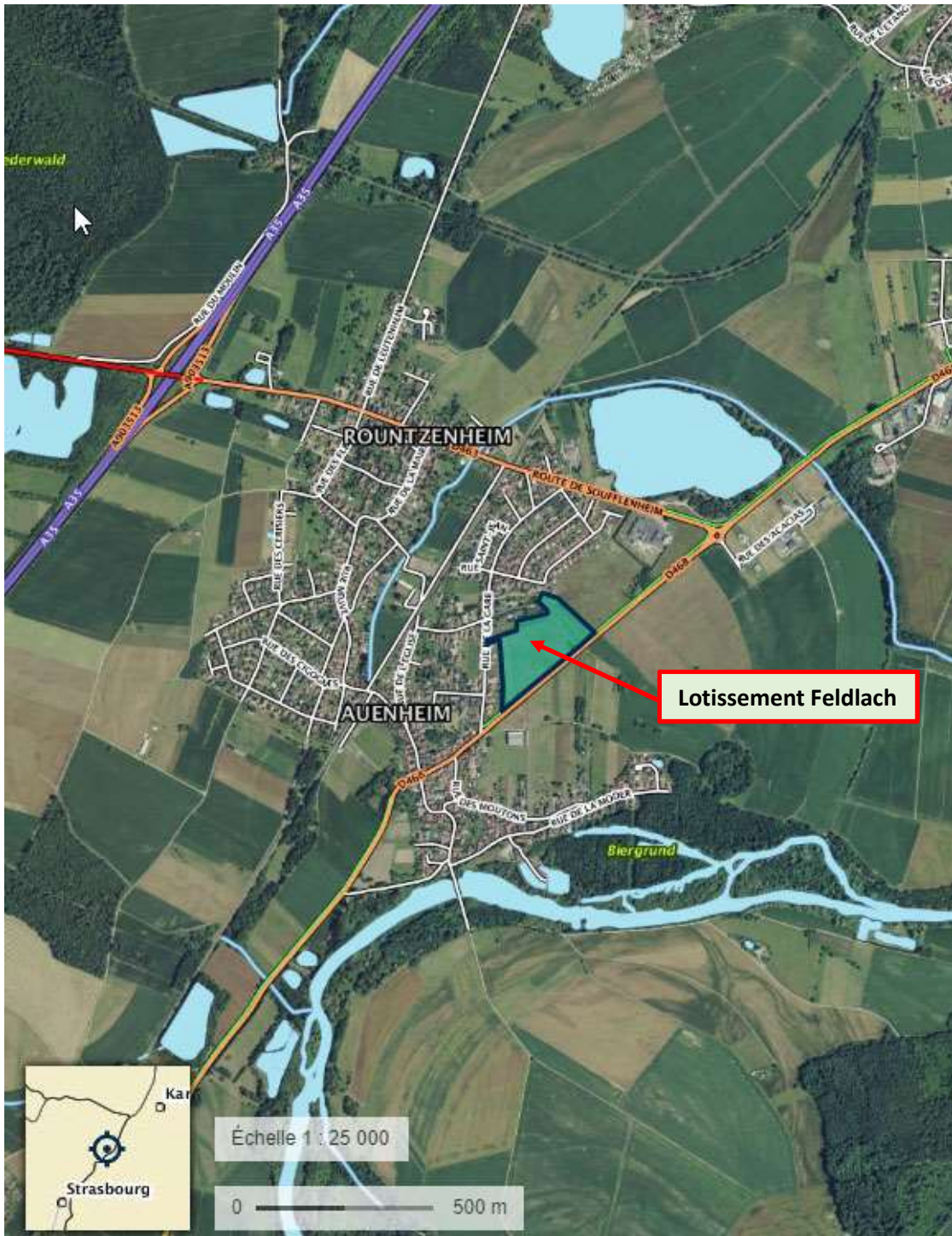
Plan de situation général 1/25 000