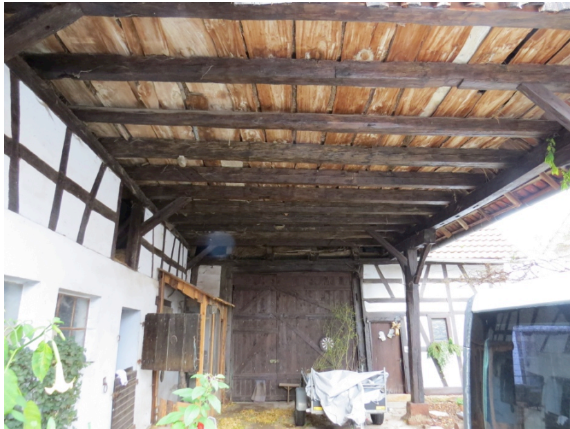
Porche de la grange de Nicolas Keller (2 nids sur les poutres)

Ce site n'est néanmoins pas forcément prioritaire dans la mesure où il semble déjà offrir des conditions favorables aux hirondelles qui n'occupent pas tous les nids et espaces favorables disponibles.