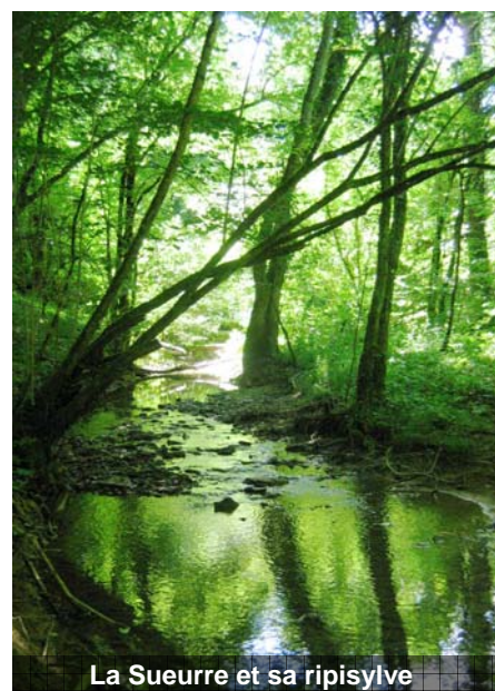
La Sueurre et sa ripisylve

OFFICE NATIONAL DES FORETS Bureau d'Etudes Bourgogne Champagne-Ardenne Centre forestier de Blanchefontaine 52200 LANGRES Tel : 03 25 88 28 80