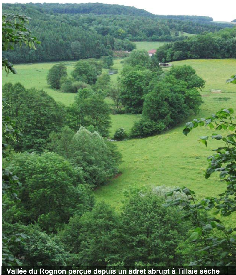
Vallée du Rognon perçue depuis un adret abrupt à Tillaie sèche