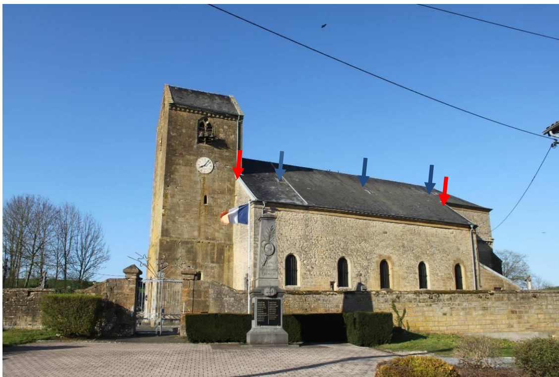
Figure 1 : Eglise et localisation des aménagements