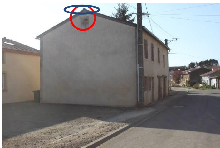
Figure 2 : Bergerie et localisation de l'aménagement extérieur