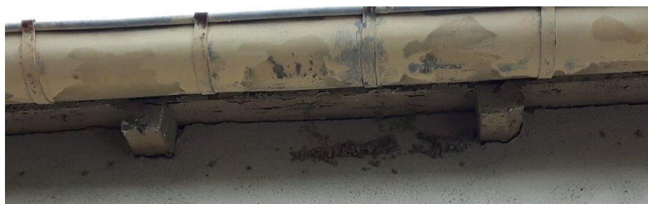
Figure 6 : Restes de nids sur la façade du bâtiment 7-1932 (janvier 2018 et juin 2019)