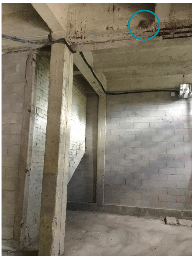
Figure 4 : Un des 3 nids du rez-de-chaussée du bâtiments 2-1941-1941 (juin 2019)

2 de ces nids semblent avoir été occupés il y a longtemps ; tandis qu'un troisième a possiblement été occupé plus récemment (année dernière, 2018), mais aucune trace d'occupation actuelle n'a été relevée (jeunes ou adultes au nid, adulte faisant des allers-retours entre le nid et l'extérieur, paillements...).