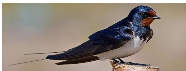
Figure 9 : Hirondelle rustique

La destruction de ces sites de nidification doit préalablement faire l'objet d'une demande de dérogation à la destruction d'habitats de reproduction et/ou de repos d'espèces animales protégées, en application de l'article L.411-2 du Code de l'Environnement.