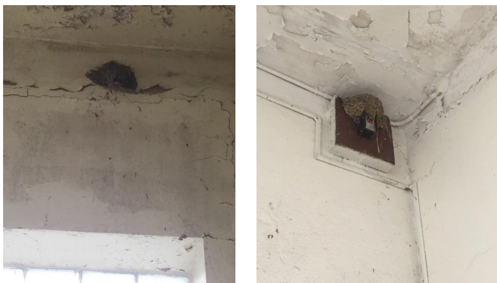
Figure 5 : Nid situé en haut de l'escalier, à gauche ; Nid fixé sur un disjoncteur, à droite (juin 2019)

Le second nid ne présentait aucune trace d'occupation récente.