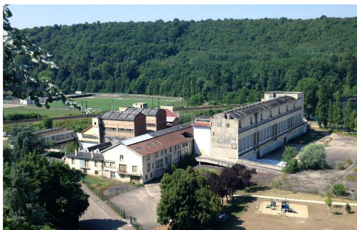
Figure 1 : Site de l'ancienne confiserie Materne-Lerebourg, à Liverdun

Afin de permettre la réalisation du projet de la collectivité, l'EPFL procède, depuis début 2018, aux études des travaux de désamiantage et de déconstruction des bâtiments, dont certains sont en train de s'écrouler. La phase opérationnelle vient de démarrer.