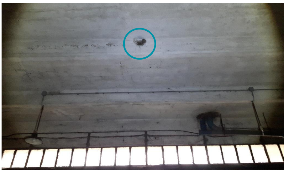
Figure 7 : Un des 3 nids au rez-de-chaussée du bâtiment 10-1941 (janvier 2018)

Notons enfin que lors du pré-diagnostic réalisé par Biotope en janvier 2018, 3 nids d'Hirondelle rustique avaient été observés à l'intérieur du rez-de-chaussée du bâtiment 10-1941. Ce bâtiment est depuis entièrement clos. Aucun oiseau n'a pu s'y introduire.