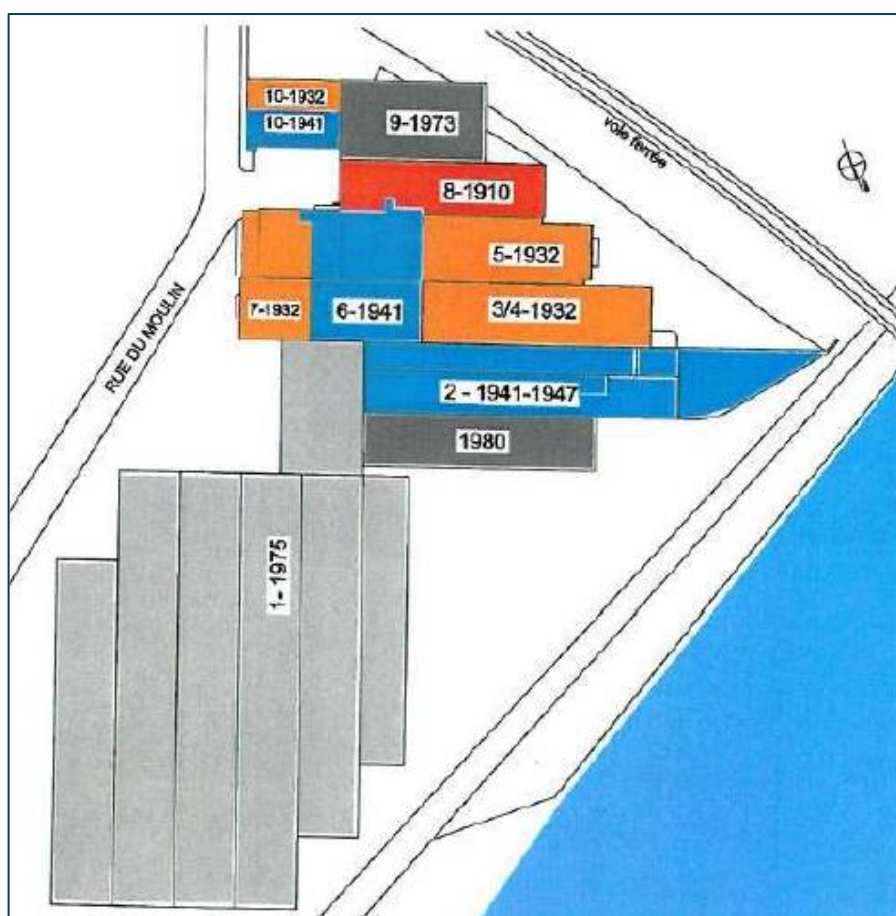
Figure 2 : Plan et numéros de bâtiments

La quasi-intégralité des façades et de l'intérieur des bâtiments a pu être inspectée.