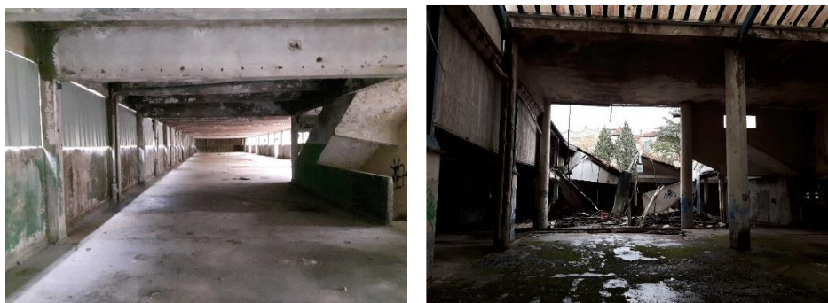
Figure 3 : Photos de l'intérieur de certains bâtiments