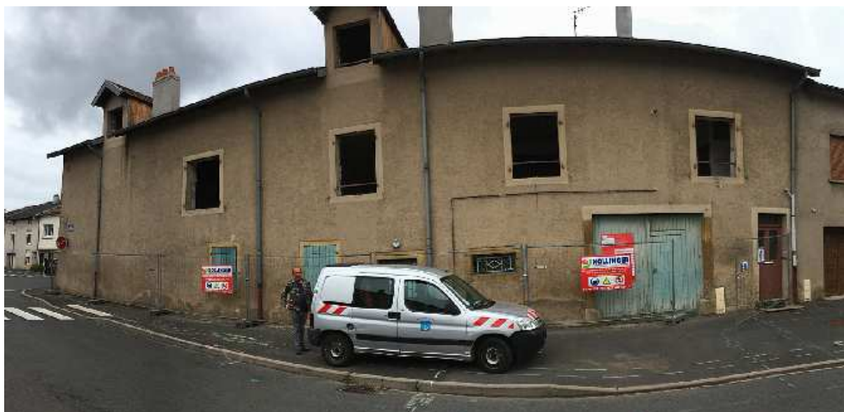
Ici le 3 rue Jean-Jacques Rousseau

Visite réalisée l'après-midi du mercredi 7 août 2019. Inspection de l'ensemble de l'Âtre sis 1 et 3 rue Jean-Jacques ROUSSEAU à Neufchef.