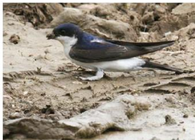
Hirondelle de fenêtre