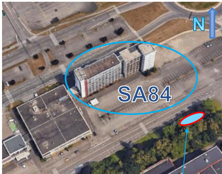
Création « Flaque de Boue »