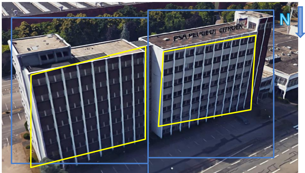
Extension Bât.SA84 Façade NORD