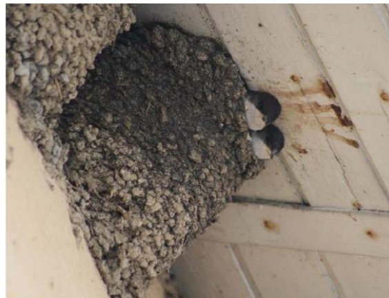
Hirondelles de fenêtre au nid