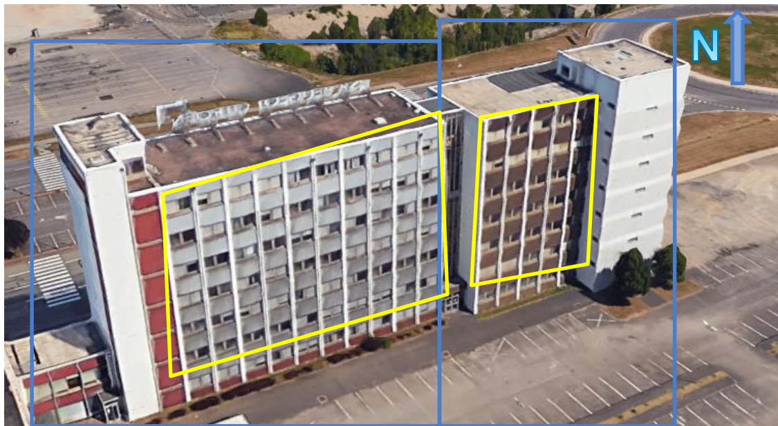
Bât. SA84 Façade SUD