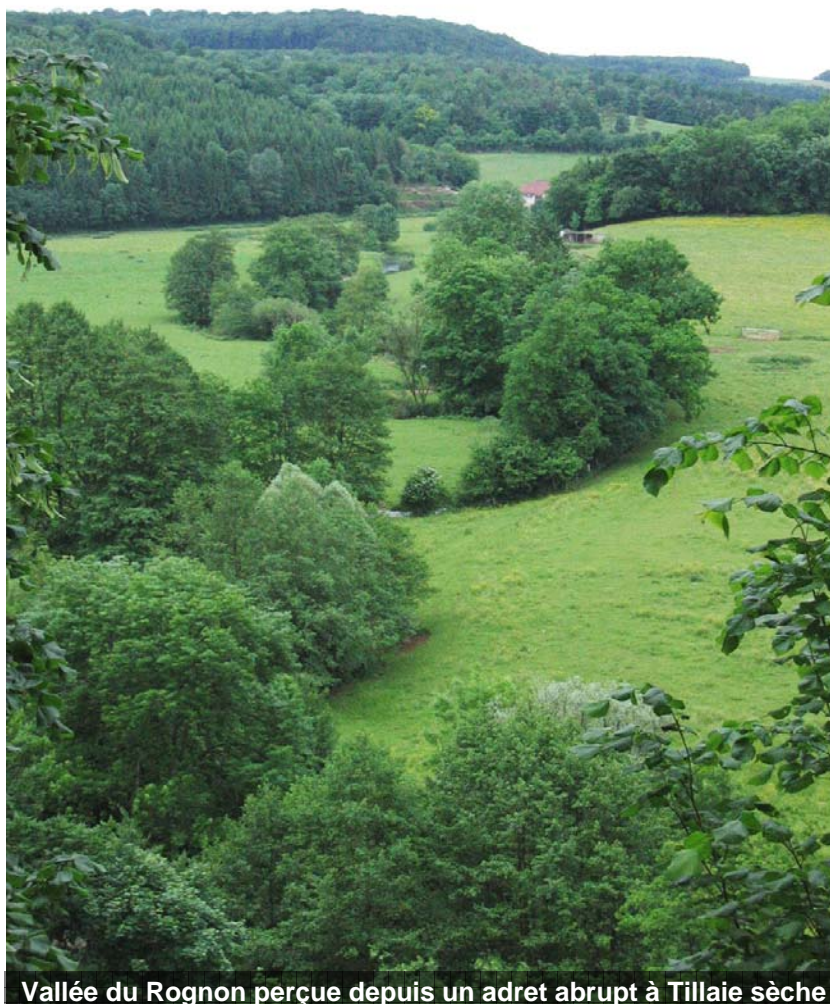
Vallée du Rognon perçue depuis un adret abrupt à Tillaie sèche