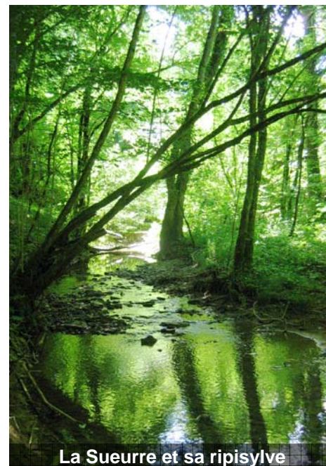
La Sueurre et sa ripisylve