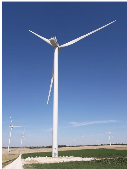
Figure 1 : Parc éolien de la "Côte Notre Dame" à Herbisse