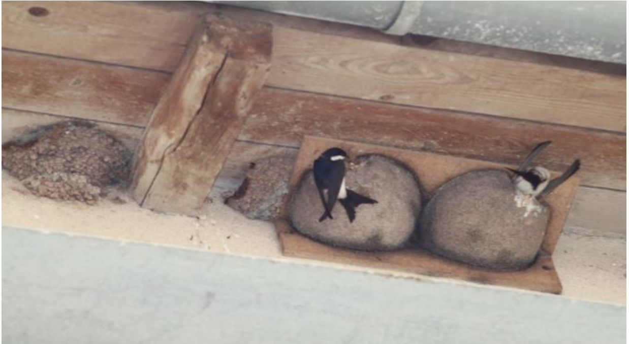
Nichoir béton bois Hironde rustique