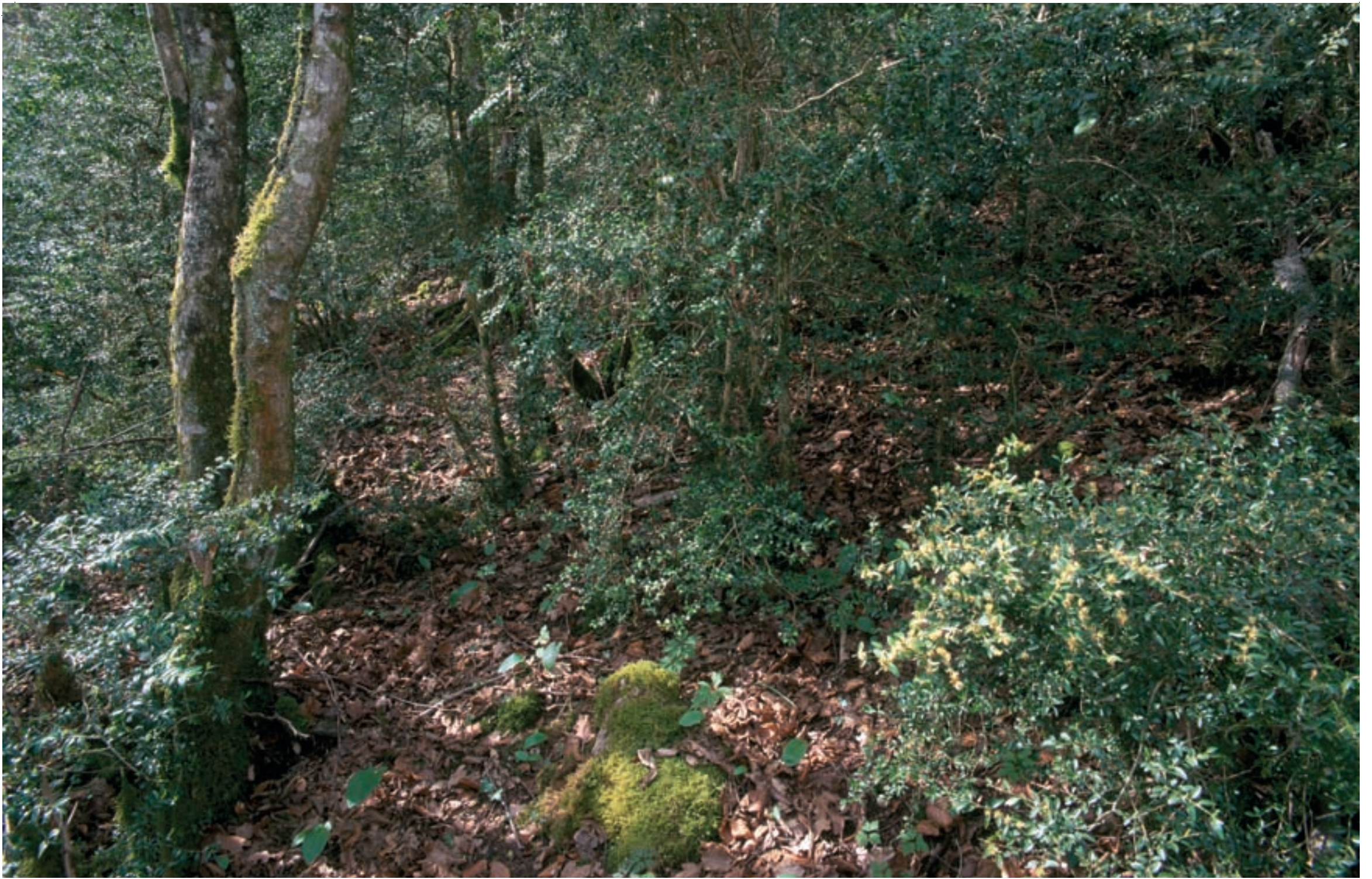
1 Buxaie dans la vallée du Rupt-de-Mad 2 Gros plan sur des branches de Buis Buxus sempervirens