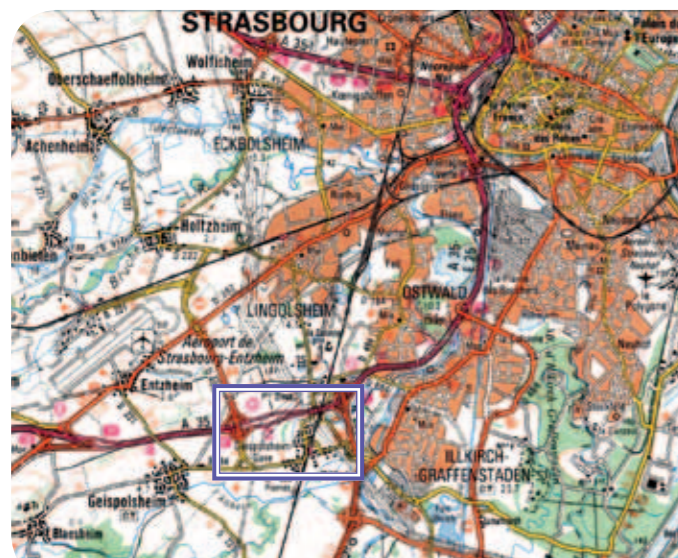
Localisation de la zone des travaux

Après une année 2017 riche en terme de travaux, point sur l'avancement des différents chantiers :