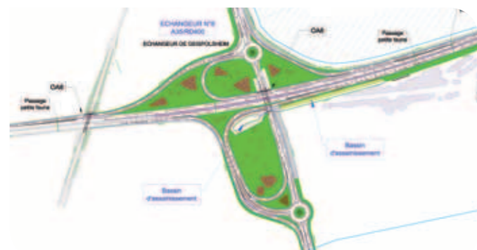
Plan de l'échangeur A35/RD400 à l'issue des travaux

La nouvelle bretelle de sortie vers Geispolsheim et Entzheim en venant de Strasbourg sera ouverte mi-avril.