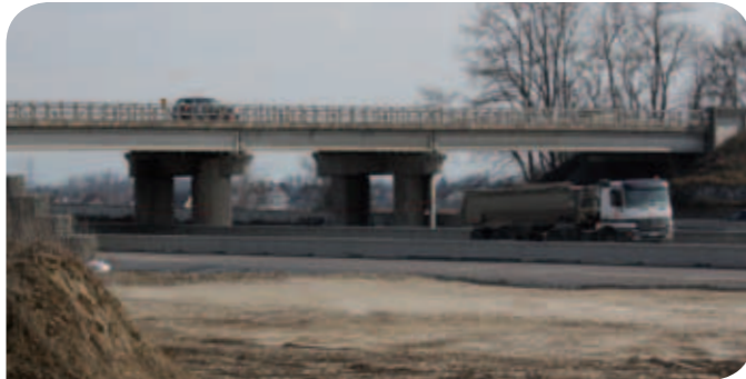
L'OA6 aujourd'hui et lors de son inauguration en 1984

Construit en 1983 et 1984 lors de la construction de la RD400 qui raccorde l'A35 à l'aéroport, l'OA6 va bénéficier, cet été, d'importants travaux de rénovation.