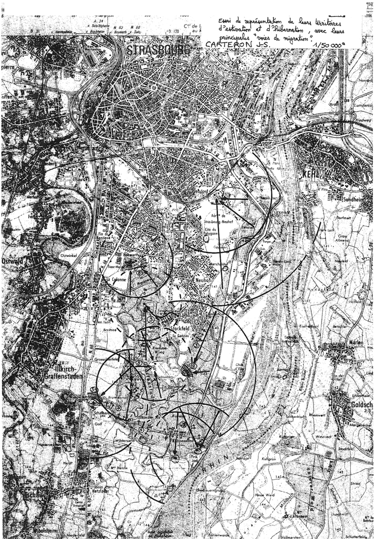
Extrait des travaux de J.S. CARTERON (1989) : Amphibiens écrasés sur les routes, essai de représentation des territoires d'estivation et d'hivernation avec leurs principales voies de migration