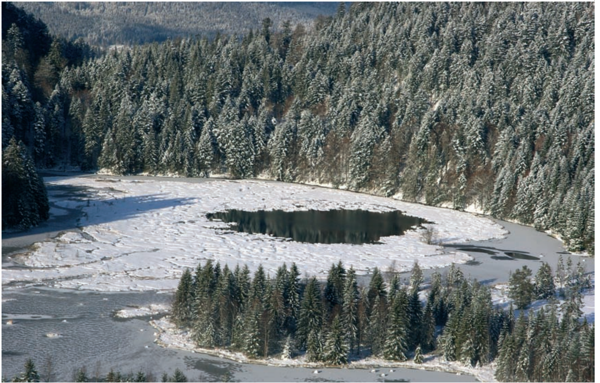
1 Le site de la tourbière de Lisbach en hiver 2 Æschne subarctique