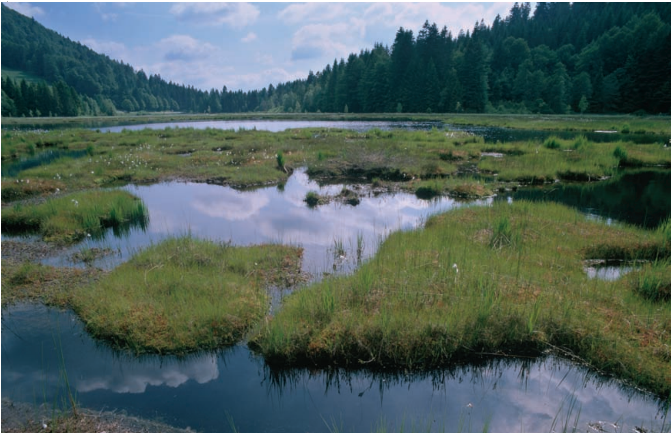
1 La tourbière tremblante de Lispach 2 Groupe de Nacrés de la Canneberge, papillon typique des tourbières acides