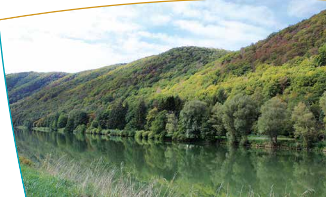
La Meuse au sein du site

grandiose de l'adultère puni des Dames de Meuse : les trois fils du seigneur d'Hierges, après avoir épousé les trois filles du seigneur de Rethel (Berthe, Hodiernne et Ige), partirent pour la croisade, laissant leurs épouses qui furent infidèles. Dieu, pour les punir de n'avoir pas su loyalement garder le pacte conjugal, les changea en trois énormes rochers à l'heure précise où Jérusalem était prise d'assaut. On voit aujourd'hui ces trois masses rocheuses agenouillées pour toujours au bord de la Meuse.