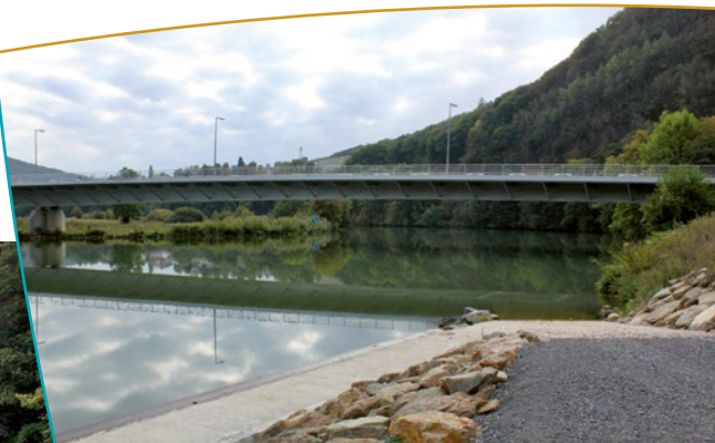
Aménagement des berges au sein du site