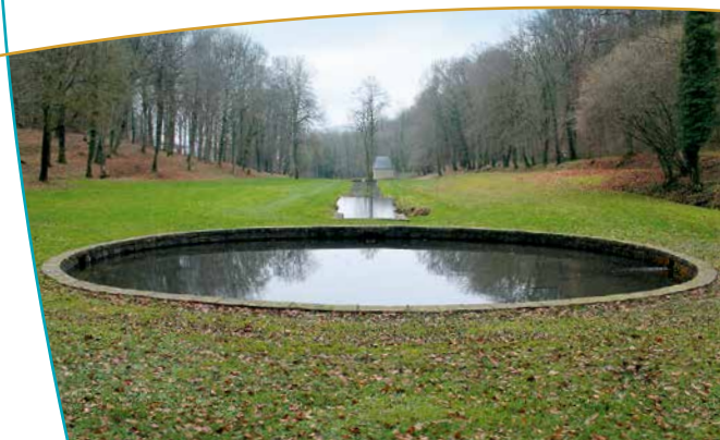
La succession de bassins du fond de vallon vers la chapelle