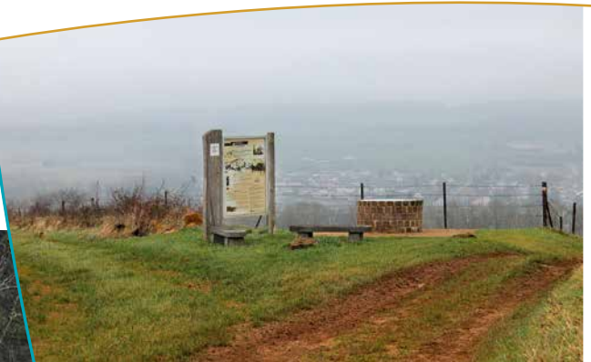
Chemin d'accès surplombant la vallée de la Meuse