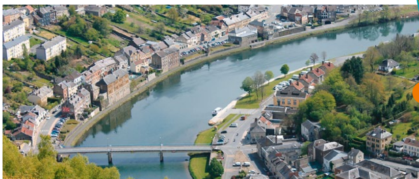
Point de vue depuis la Longue Roche