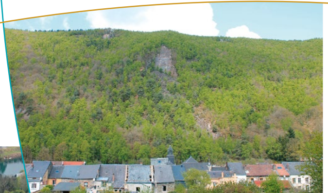
La Longue Roche vue de Monthermé