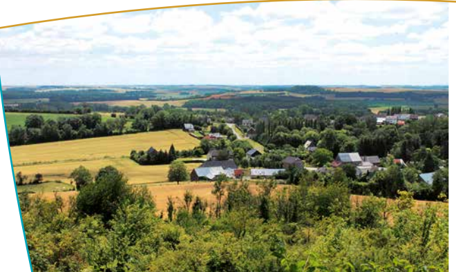
Vue du village de Séry depuis le mont

de l'ensemble des Monts de Séry : cultures, fruticées, talus, bois. Les points de vue sont remarquables avec la découverte de la côte et du plateau de Champagne jusqu'à Reims et les Monts de Berru au sud-est, le Laonnois au sud-ouest, les monts et les paysages du Porcien et du Rethélois d'est en ouest et enfin les franges forestières des crêtes préardennaises au nord. L'autre particularité des Monts de Séry est leur mise en valeur agricole. Par un travail séculaire, les agriculteurs y ont aménagé les fortes pentes en une multitude de talus appelés localement "Orles" qui donnent un caractère typique aux versants et beaucoup de mouvements.