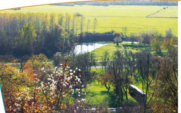
L'Aisne depuis l'observatoire

Le périmètre du site inscrit actuel ne correspond qu'à une partie des parcelles ouvrant sur le panorama de 180°. De plus, il concerne des terrains privés en pente pour lesquels la mesure d'inscription ne peut régler le développement de la végétation et plus particulièrement les boisements qui peuvent s'avérer particulièrement néfastes pour le dégagement visuel, nécessaire à la découverte du panorama. Des aménagements ont été réalisés sur l'observatoire : bancs, table de pique-nique, panneau d'information, barrière en bois et table d'orientation.