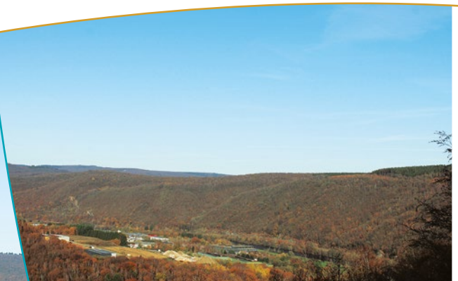
Panorama depuis le point de vue