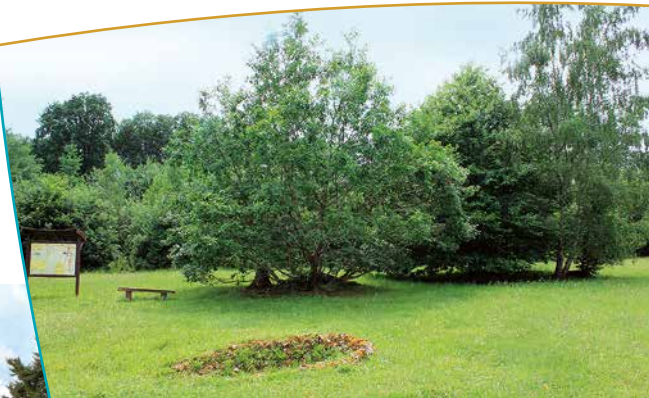
Vue d'une partie du parc à proximité de la chapelle