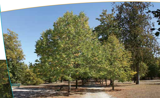
Allée principale du parc