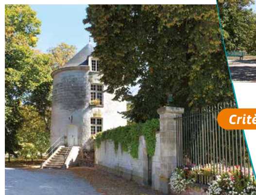
La tour d'enceinte

presque tout le parc. Plus de 1 700 arbres ont été cassés dont 600 arbres de taille importante. Les déboisements ont ouvert des vues du parc sur des constructions voisines peu esthétiques.