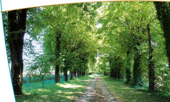
Allée d'arbres menant à l'entrée du château

Le début du XIX ème siècle semble une période faste, attestée par l'importance des boiseries Empire ou Restauration dans le décor des pièces.