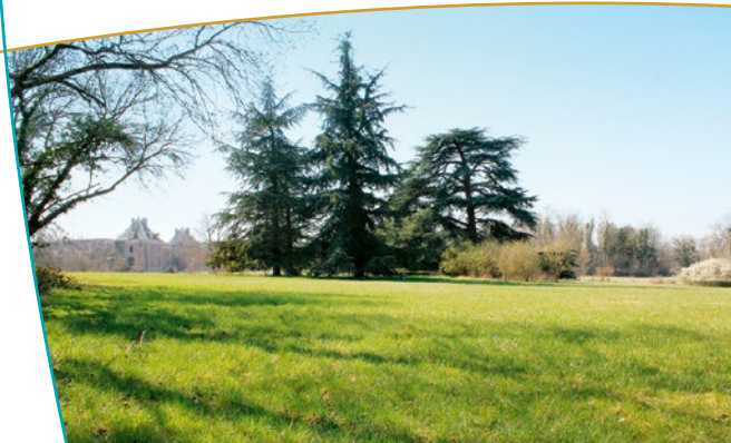
Vue du parc avec le château en arrière-plan

Un parc de belle taille entoure ces bâtiments. Au plus proche du château, se dessine un parc anglais aux allées sinueuses. Un peu plus loin, le parc a conservé un tracé à la française, parfaitement géométrique. Au sein de cet espace, de grandes pelouses sont actuellement entretenues par le pâturage. Devant la grande porte du mur à arcades, s'aligne une majestueuse allée forestière avec deux contre-allées.