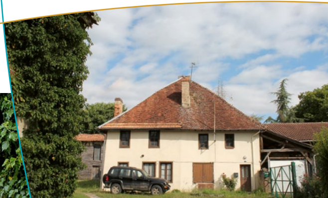
Maison et cour intérieure