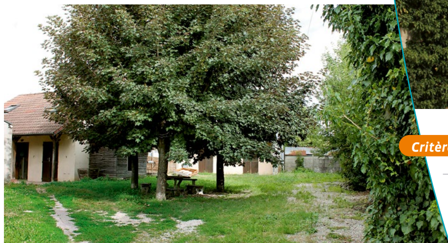
La cour intérieure

C'est l'aspect pittoresque de cet ensemble constitué par la cour et les maisons qui la bordent qui a justifié l'inscription à l'inventaire.