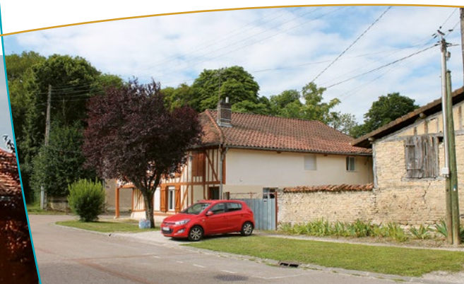
Vue sur la maison depuis le boulevard Napoléon