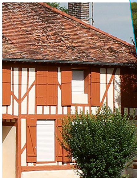
Détail de la façade

À l'angle du boulevard Napoléon et de la rue Vallée (qui sont deux artères principales de la ville) se trouve une maison ancienne, à pans de bois, très pittoresque. Elle est un des rares éléments patrimoniaux anciens survivants de Brienne-le-Château et méritait à ce titre une protection. Il s'agit d'un ancien relais de poste.