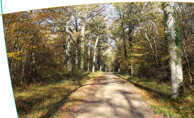
Perspective au sein du site