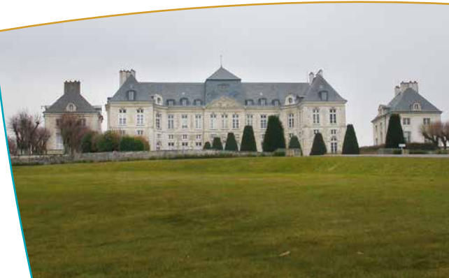
Pelouses du château

Ce beau domaine est devenu tour à tour hôpital (1939-40), garnison de l'armée allemande, camp de prisonniers de guerre en 1949. Il a été racheté par le département de l'Aube pour devenir un hôpital psychiatrique depuis 1959. La cour d'honneur est composée de deux parterres de pelouses ponctués d'ifs coniques et de plate-bandes de fleurs. Elle est limitée sur les côtés par un quadruple alignement de tilleuls que l'on retrouve à l'arrière du château.